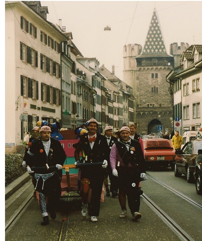
Bild vo dr Fasnacht 1993