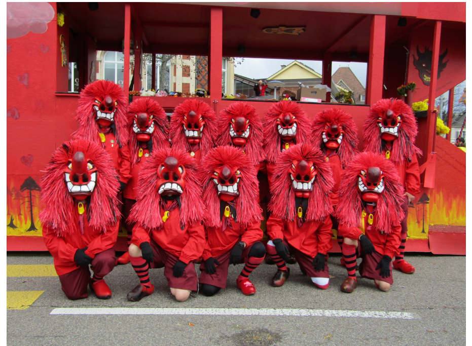
BILD VO DR FASNACHT 2024